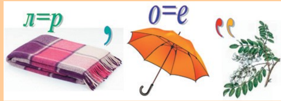
Ребус № 2