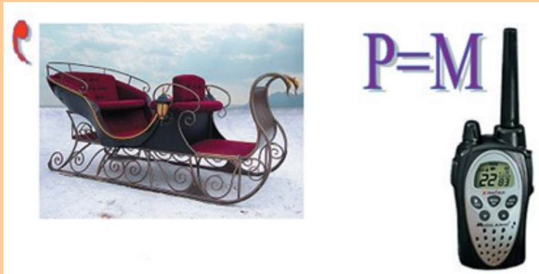
Ребус № 3