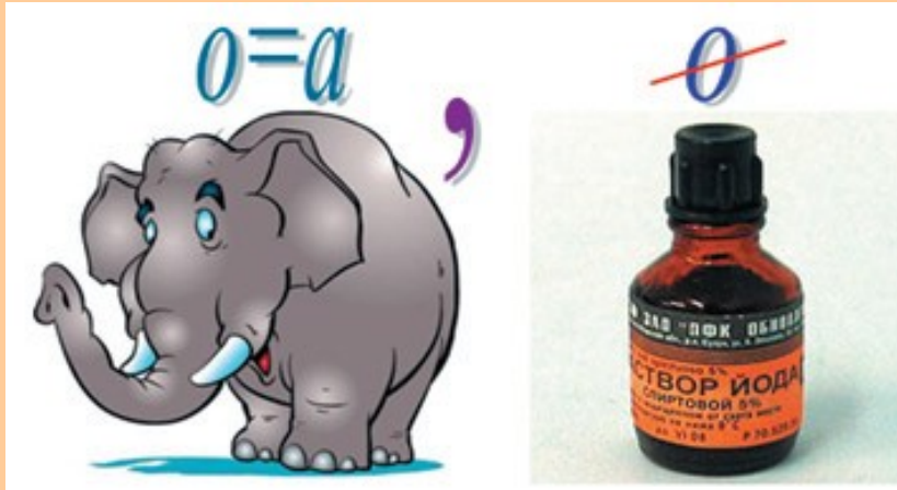
Ребус № 1